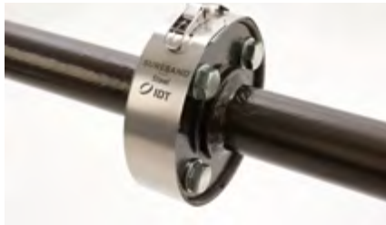
Spritzschutzband Sureband® Steel 316 Edelstahl | 9509WP

Bis 200 °C · über 50 bar · ½" bis 6" · 5 Größen für 28 Standardflansche